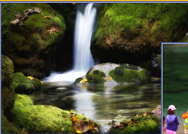
Le nostre acque...